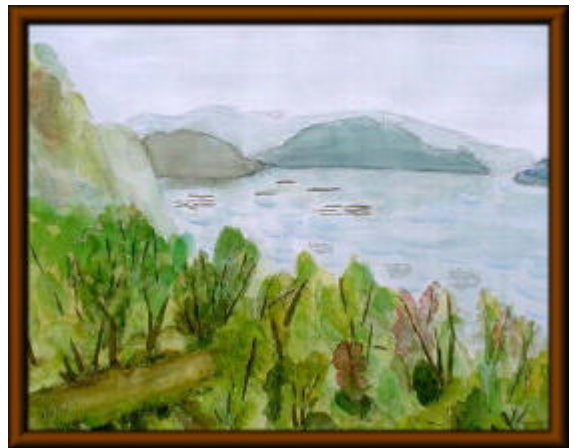
八巻 悟郎 (昭40経)