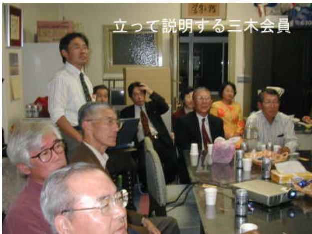
立って説明する三木会員

シドニー、アテネの各オリンピック会場の比較、そしてシドニーで初めて正式種目になった馬術を通して『パラリンピック』(*)特有の課題など、我々も考えさせられることの多いお話でした。