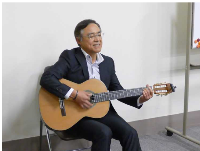
（小椋桂／さらば青春・白い一日）